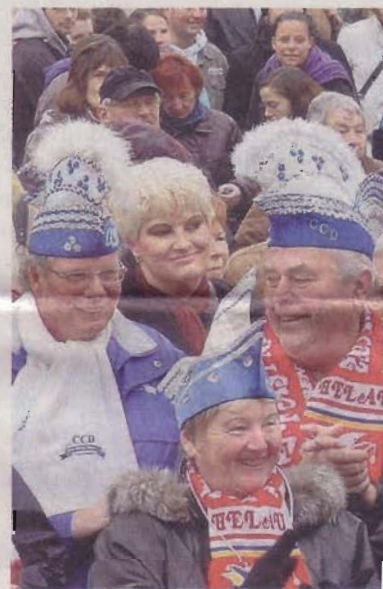
Närrisches Volk versammelte sich auf dem Marktplatz.